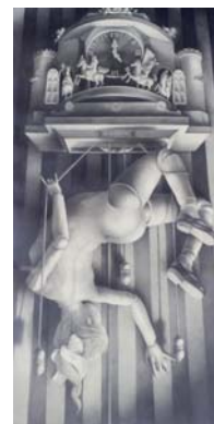
建石修志 「落下するアリスもしくは五時の行進」 72x36.6cm 鉛筆・紙