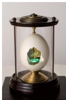
桑原弘明 「卵の中の世界」 W7xH10x7cm mixed media 1994年