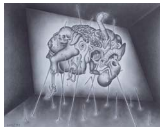
篠田教夫 「歪む部屋」 21.5x27cm 鉛筆・紙 1982年