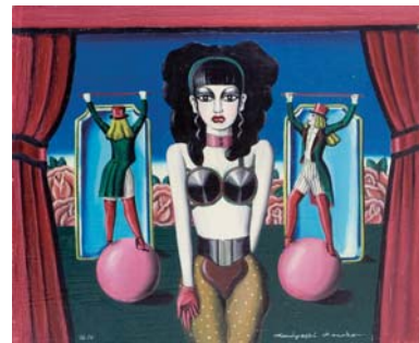
金子國義 8F oil on canvas 1968年