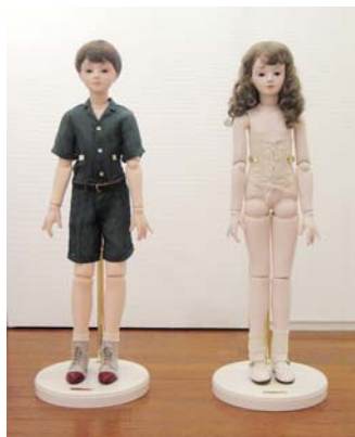
四谷シモン H80cm mixed media 1984年