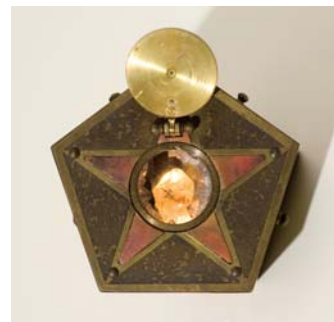
桑原弘明 「封印説」 W5xH4x5cm mixed media 2002年