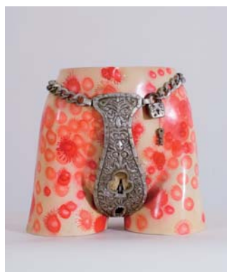
土井典 W27xH30x25 mixed media