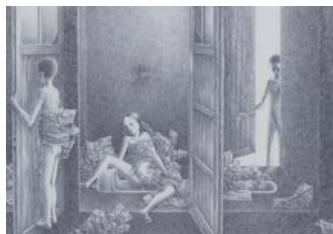
片山健 「美しい日々より」 24.5x35.5cm 鉛筆・紙 1969年