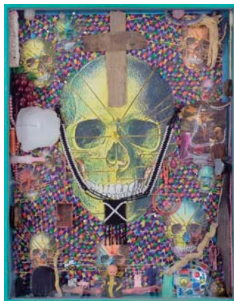
合田佐和子 「クロスペンダント」 W67xH52x6cm mixed media 1982年