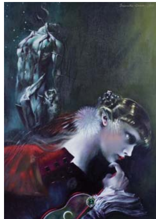
合田佐和子 「中国の不思議な役人」 30P oil on canvas 1977年